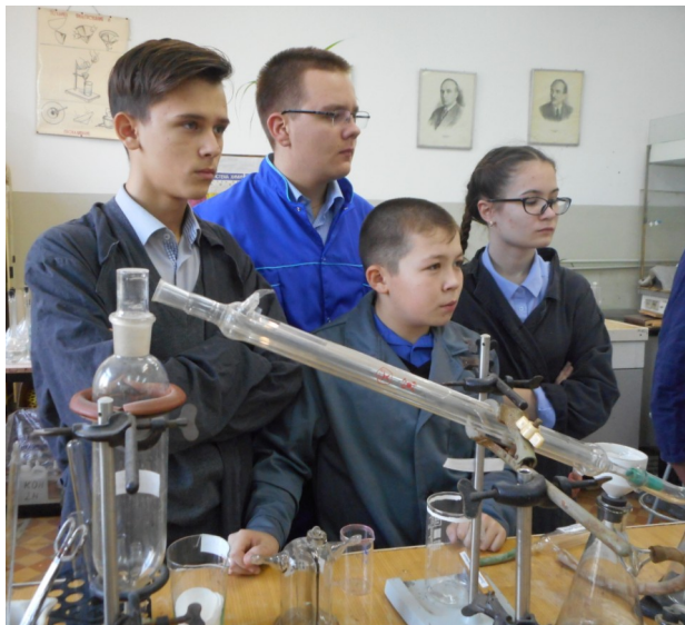
8 класс. Экскурсия в химическую лабораторию ОТИ МИФИ