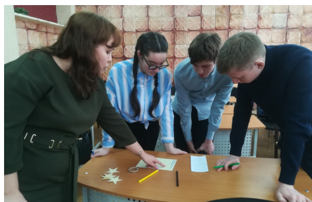
10 класс. Занятие с элементами тренинга «Легко ли стать успешным?»