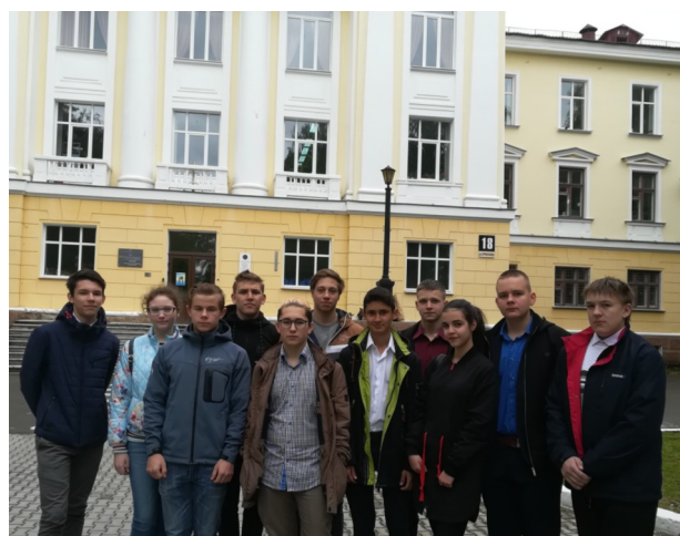
8 класс. Экскурсия в Центральную заводскую лабораторию ФГУП «ПО «Маяк» (8, 10 классы)