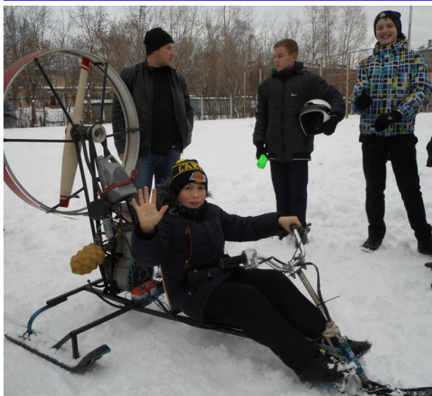
7 класс. Открытие технического проекта «АЭРОСАНИ».