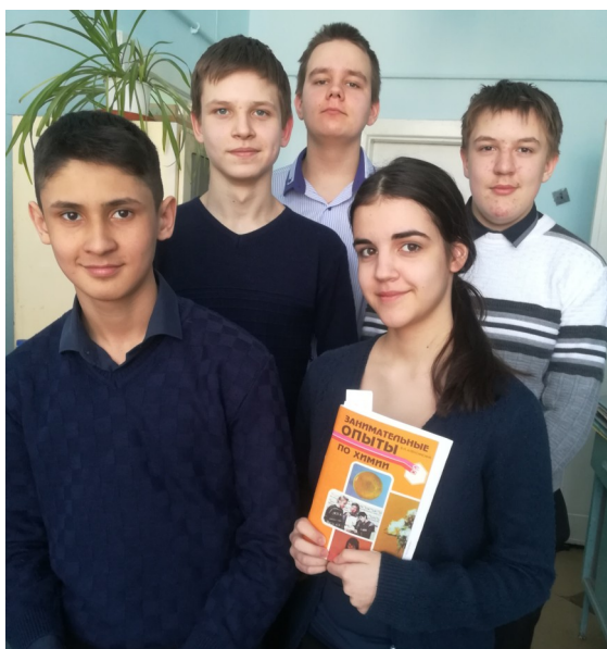
8 класс. Участие в исследовательском проекте «Получение малахита в школьной лаборатории».