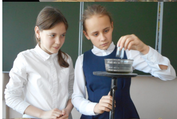
6 класс. На занятии курса «Химия вокруг нас»